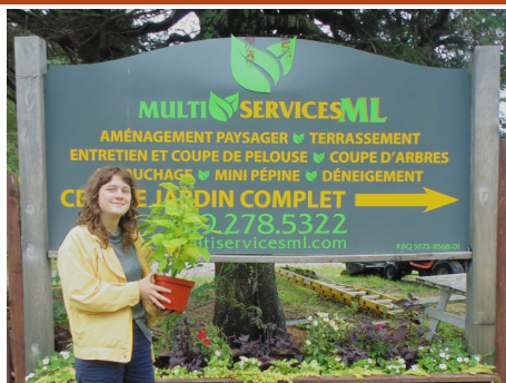
Gagnante du concours « Aussi bonne que belle »